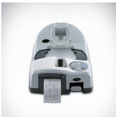
In die Basisstation integrierter Drucker

Ob integrierter Drucker oder die beiden optionalen Transportkoffer – alle Detaillösungen und auch das Zubehör sind durchdacht und konsequent für den mobilen Einsatz konzipiert.